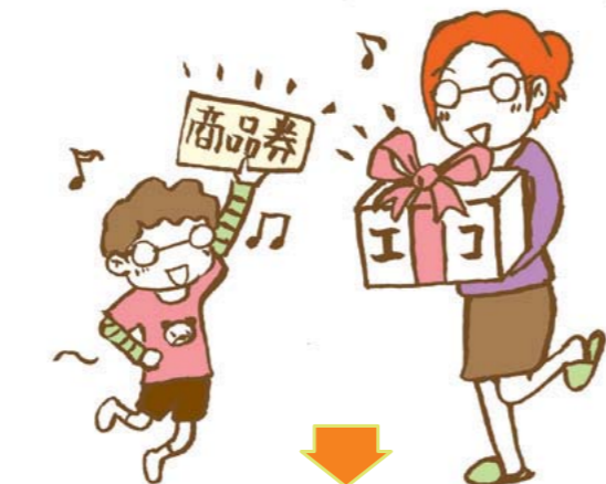
■ 商品に交換する場合のエコポイント発行の流れ