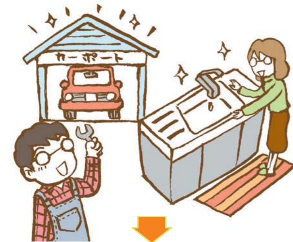
■ 即時交換制度によるエコポイントの流れ

取得したポイントは同時に行うエコポイント対象工事以外の工事費用に充当することができます(即時交換制度)。エコポイントの申し込み手続きのわずらわしさが軽減されるのでおすすめです。キッチンのグレードアップや食洗器の購入、外構工事など用途はどんなものでもかまいませんが、エコポイント対象工事を請け負った会社が行う工事に限られます。